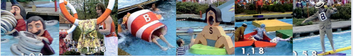
Schnappschüsse beim Wasser-Wettkampf in Seesen

Auf jeden Fall kennen das Ereignis alle Baesweiler, die älter als 60 Jahre alt sind. Es war DAS Ereignis 1975. Damit ist nicht die Verleihung der Stadtrechte an die Gemeinde Baesweiler gemeint - obwohl auch ein wichtiges Ereignis. Es ist der Auftritt der Baesweiler Sportler in der europaweit übertragenen Fernsehshow „Spiel ohne Grenzen“! Wie kam das zustande?