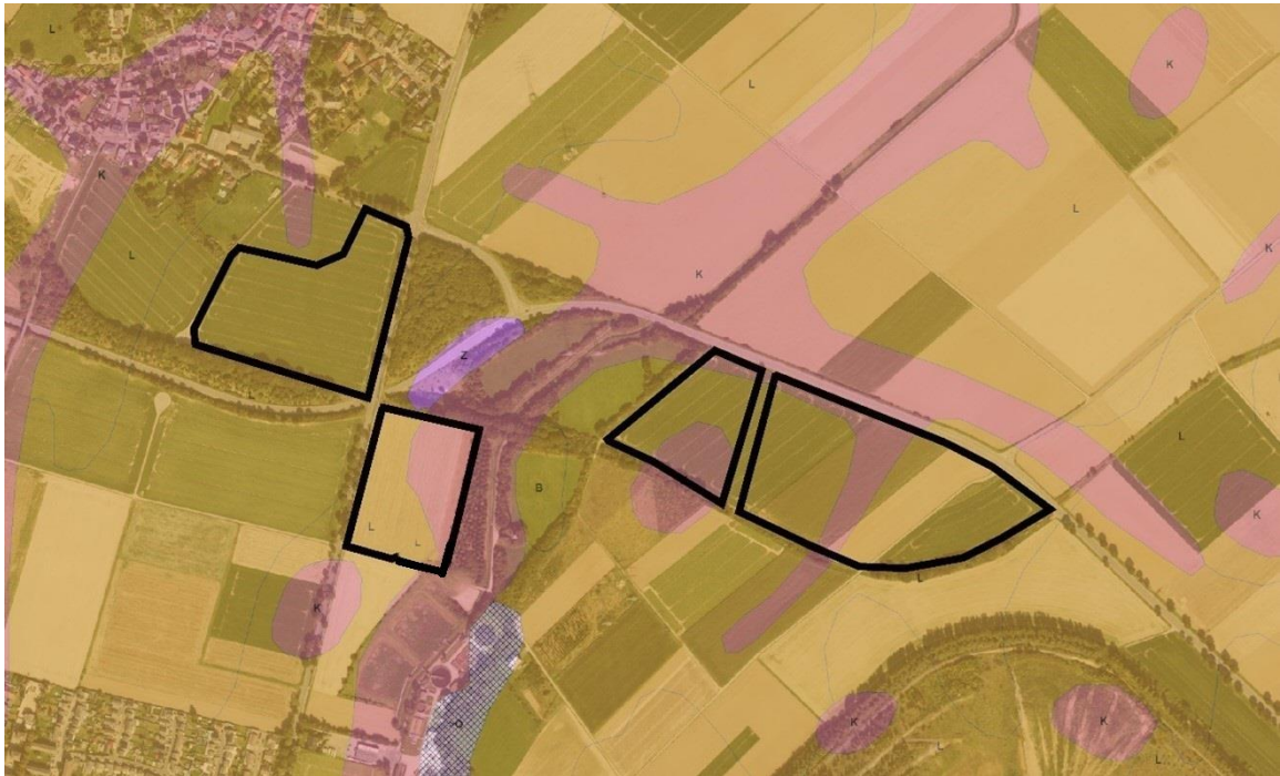
Abbildung 7: Bodenkarte mit Abgrenzung des räumlichen Geltungsbereichs (schwarze Linien), genordet (Land NRW, 2023) sowie (GD NRW, 2018 b)

Für die Bewertung des Bodens werden die Geobasisdaten der Vermessungs- und Katasterverwaltung NRW (Land NRW, 2023) und die Bodenkarten im Maßstab 1 : 5.000 (GD NRW, 2018 a) und 1 : 50.000 (GD NRW, 2018 b) verwendet. Hieraus ergeben sich die folgenden Erkenntnisse.