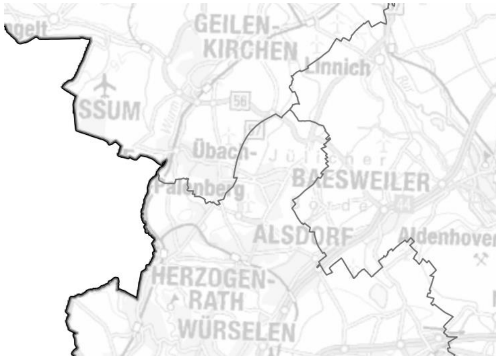
Abbildung 2: Auszug aus der Karte zur Steuerung der Windenergienutzung im Übergangszeitraum

Das Land NRW hat den Nachweis über das Erreichen der Flächenbeitragswerte von 1,8 % des Wind-an-Land-Gesetzes auf die Regierungsbezirke übertragen. Für den Übergangszeitraum bis zur Ausweisung von WEB in den Regionalplänen gab das Land NRW eine „Karte zur Steuerung der Windenergienutzung im Übergangszeitraum“ heraus. In ihr sind für Baesweiler keine Kernpotenzialflächen festgelegt. Nur in den Kernpotenzialflächen sollen WEA im Zeitraum zwischen dem Erlass des neuen LEP und seiner Umsetzung in der Regionalplanung vereinfacht möglich sein. Diese Flächen eignen sich mangels raumordnungsrechtlicher Restriktionen und der Möglichkeit zur Konzentration des Windenergieausbaus besonders für die Übernahme in die Regionalplanung. Auf andere Flächen würde ein Ausbau der Windenergie den Erfordernissen der Raumordnung möglicherweise widersprechen und es ist eine Einzelfallprüfung erforderlich (vgl. Kapitel 1.2.2).