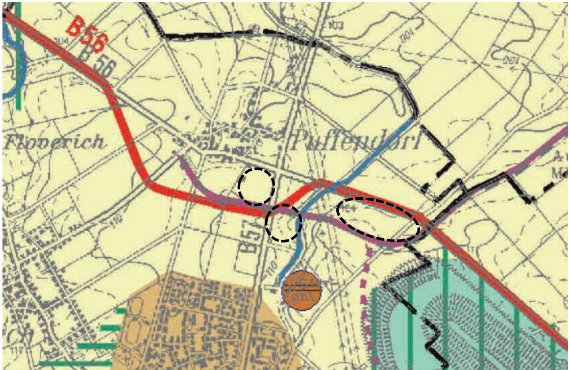
Abbildung 3: GEP Region Aachen mit Markierung der räumlichen Geltungsbereiche (schwarz gestrichelte Kreise), genordet (Bezirksregierung Köln, 2016 a)