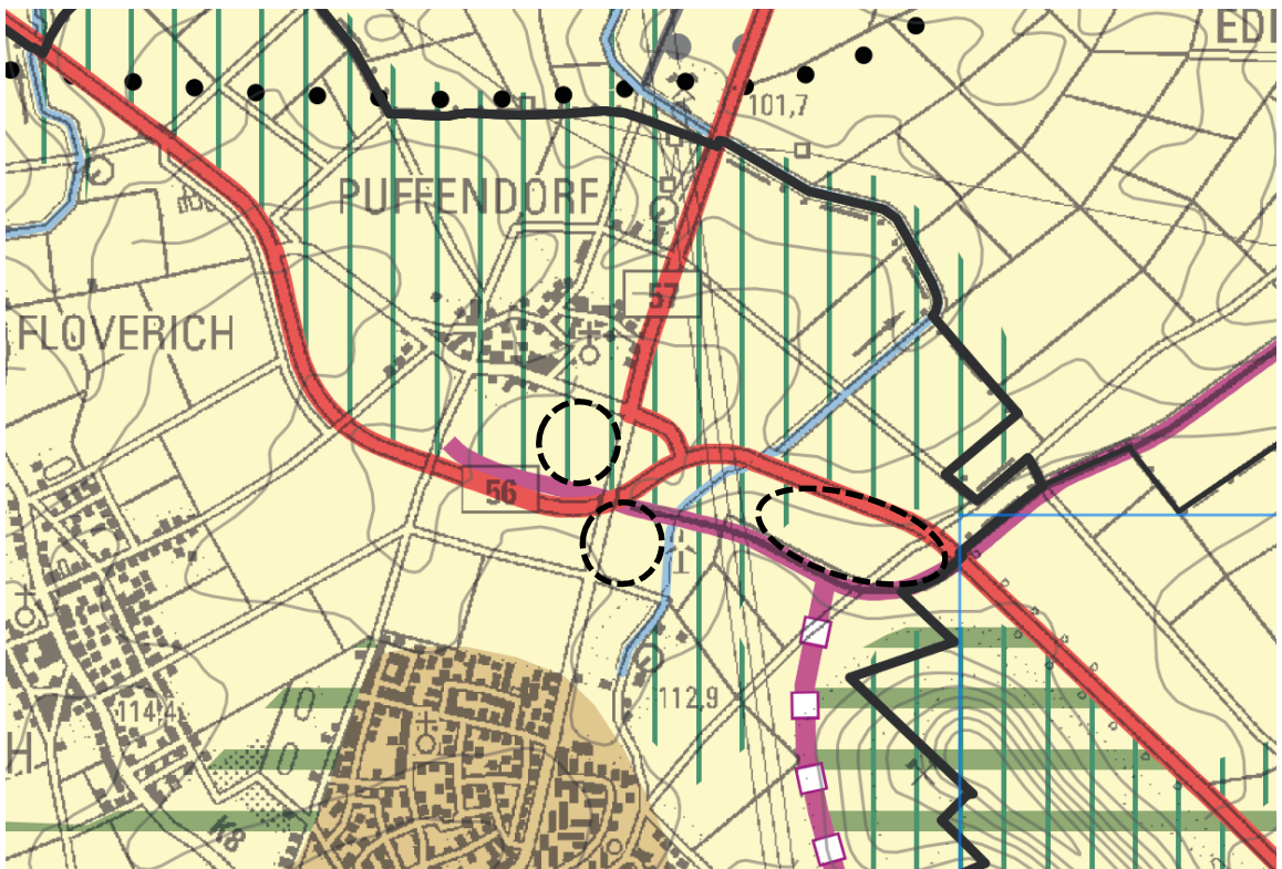
Abbildung 4: Ausschnitt aus der Neuaufstellung des Regionalplans Köln (Entwurf), genordet (Bezirksregierung Köln, 2024)