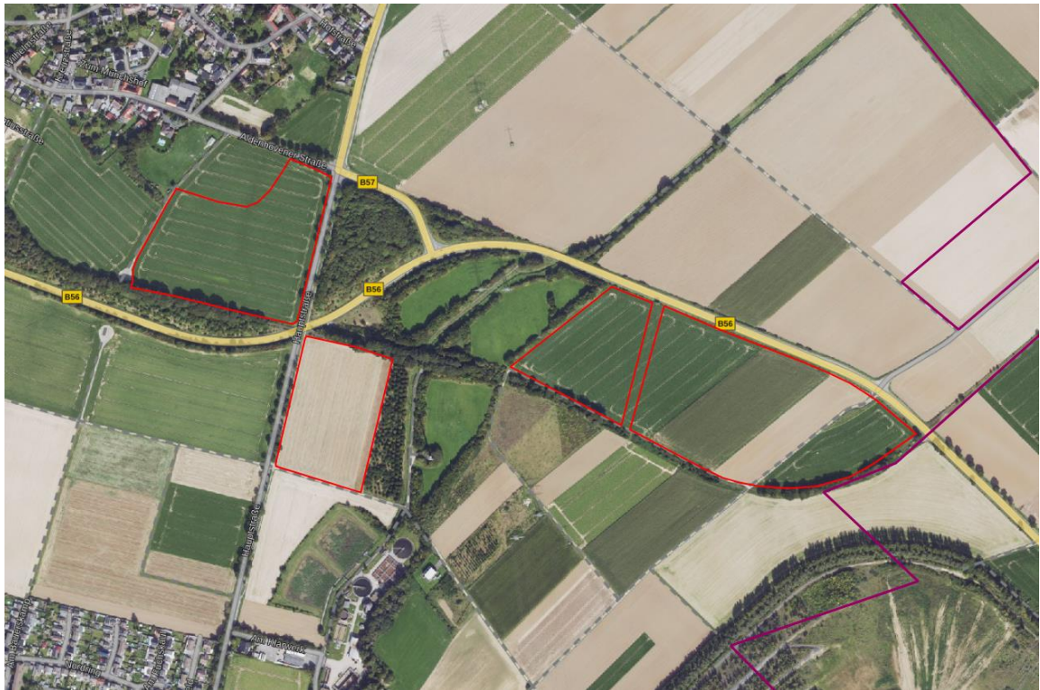
Abbildung 1: Lage der zusätzlichen Fläche (rote Umrandung), genordet (Land NRW, 2023)

Die beiden östlichsten Teilflächen in der Gemarkung Puffendorf, Flur 3, Flurstücke 353, 355, 356, 370 sowie Teile der Flurstücke 354 und 345, werden von der Trasse einer unterirdischen Zeelink-Pipeline getrennt und sind 2,7 bzw. 7,9 ha groß. Beide Teilflächen werden landwirtschaftlich genutzt. Im Westen und Süden werden sie von einer Baum- und Gebüschstruktur begrenzt. Entlang der südlichen Grenze verläuft eine ehemalige Bahntrasse, die inzwischen überwuchert ist.