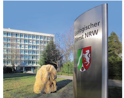
Geologischer Dienst NRW in Krefeld

Über die geplanten bodenkundlichen Kartierungen werden die betroffenen Kreisverwaltungen sowie die zuständigen Landwirtschaftskammern und Regionalforstämter rechtzeitig schriftlich informiert. In der Regel werden die Informationen im Amtsblatt oder durch Aushang veröffentlicht. Es wird um Verständnis dafür gebeten, dass eine persönliche Unterrichtung bei der Vielzahl von Grundstückseigentümer*innen oft nicht möglich ist.