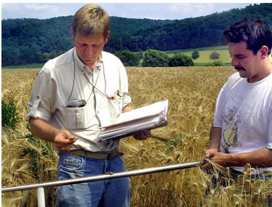
Beurteilung der Bodeneigenschaften durch den Geologischen Dienst

Danach sind die Mitarbeiter*innen und Beauftragten des Geologischen Dienstes NRW berechtigt, Grundstücke – nicht die Gebäude – zu betreten und die notwendigen Arbeiten vorzunehmen. Auf forstliche und landwirtschaftliche Belange und die Nutzung der Grundstücke wird soweit wie möglich Rücksicht genommen. Falls trotzdem durch die Arbeiten Schäden entstehen, werden diese nach den allgemeinen gesetzlichen Bestimmungen ersetzt.